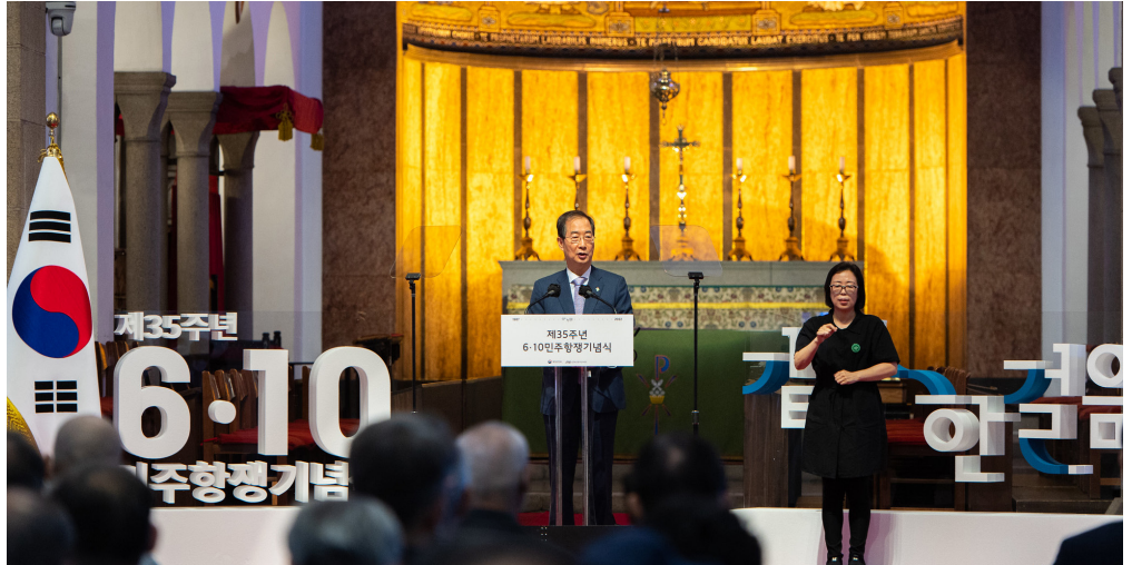
한덕수 국무총리가 지난해 6월 10일 서울시 중구 대한성공회 서울주교좌성당에서 열린 제35주년 6·10민주항쟁 기념식에서 기념사를 하고 있다.

정 12 되었다. 2·28민주운동 기념일, 3·8민주의거 기념일, 3·15의거 기념일, 4·19혁명 기념일, 5·18민주화운동 기념일, 6·10민주항쟁 기념일, 부마민주항쟁 기념일(10월 16일) 등 총 7개의 기념일에는 국가보훈부, 행정안전부 등 정부 주최로 기념식과 부대 행사가 개최되고 있다.