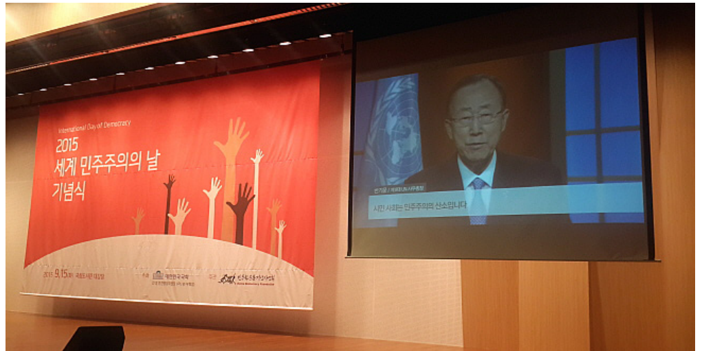
국회에서 열린 2015년 세계 민주주의의 날 기념식에서 반기문 UN 사무총장이 영상 축사를 하고 있다.

9 대한민국 국회는 2009년 김형오 국회의장의 기념사 발표에 이어 2010년 박희태 국회의장의 기념사를 발표하였다. www.assembly.go.kr/portal/bbs/B0000051/view.do?nttId=1572810&menuNo=600265