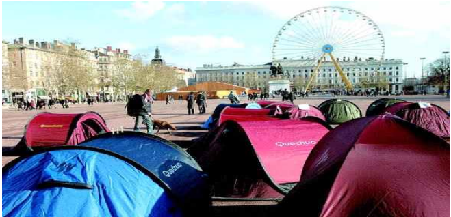
<리옹의 벨쿠르 광장에 노숙자 주거 문제 해결을 촉구하는 텐트들이 들어선 모습>

세계의 주목을 끌었던 프랑스의 노숙자 체험 텐트 시위가 값진 성과를 거뒀다.